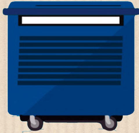
Papel y cartón