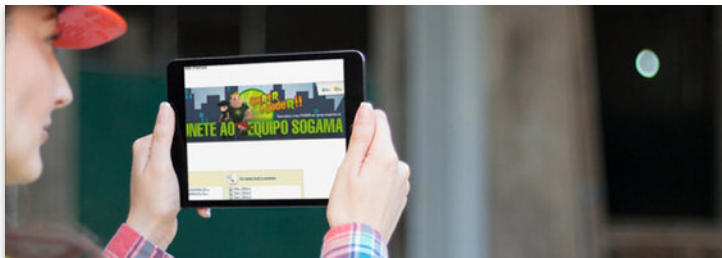
A formación online é un sistema de ensinanza moi versátil para a formación de adultos

Unha vez concluída a actividade formativa, os que así o soliciten, terán a oportunidade de visitaro complexo medioambiental de Cerceda para coñecer de preto o seu funcionamento.