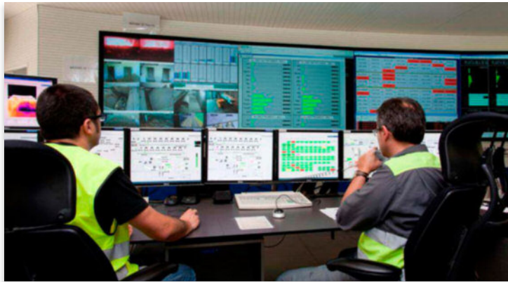
Sala de control dunha planta de valorización enerxética