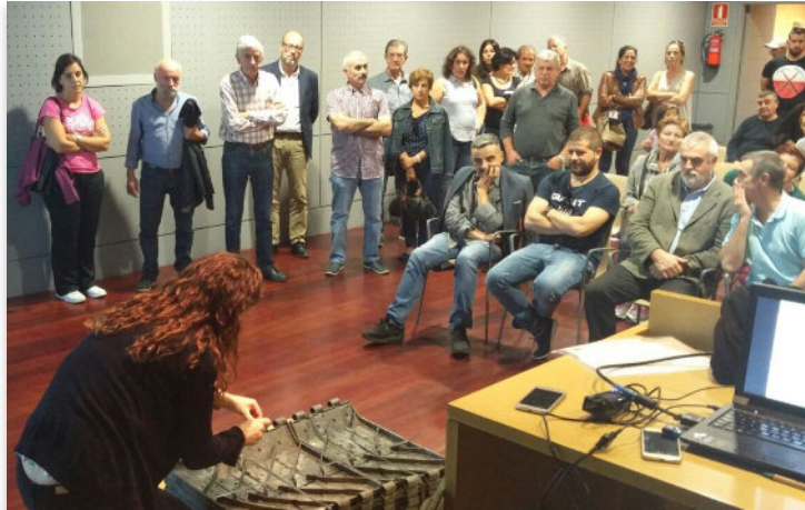
Un dos cursos de formación sobre autocompostaxe impartidos en Cedeira e Vilagarcía en semanas pasadas