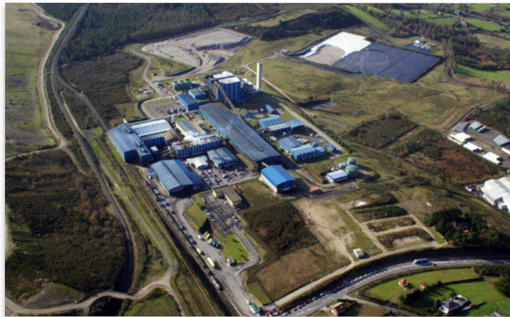
Sogama dá servizo a 295 dos 313 concellos galegos

O Alto Tribunal confirma a plena constitucionalidade da aplicación do canon único a partir de marzo de 2014