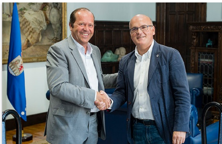
O convenio firmouse o pasado 7 de setembro

Ademais do material didáctico que se entrega en cada vivenda participante no programa de compostaxe doméstica, toda a información pode consultarse na páxina web www.compostaconsogama.gal .