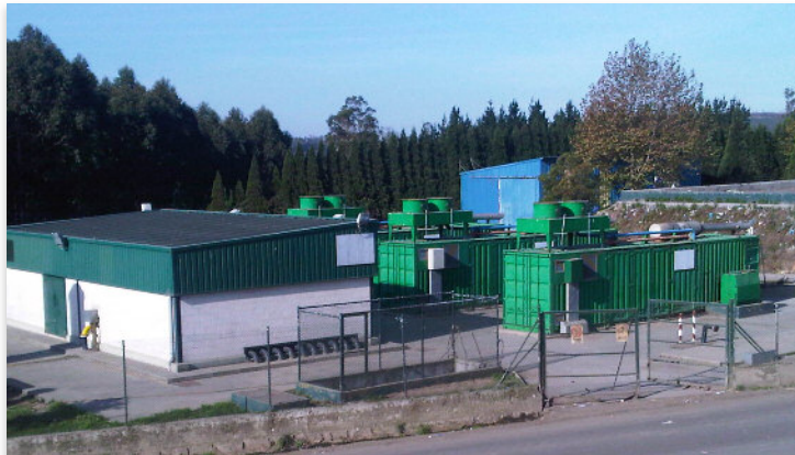
Planta de biogás no vertedoiro da Areosa, en Cerceda (A Coruña)