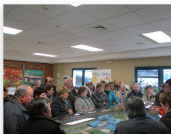
As visitas adaptanse ao perfil dos grupos, xa sexan nenos ou adultos