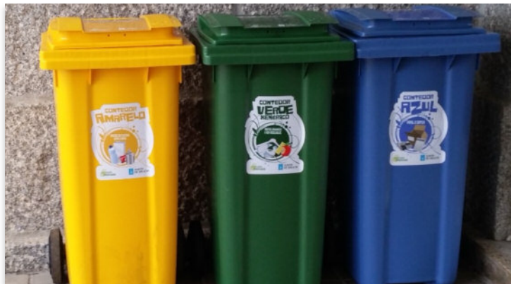
Illas de reciclaxe instaladas nos colexios