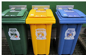
As illas de reciclaxe sitúanse en lugares estratéxicos dos colexios

Escolares de infantil e primaria de 16 colexios galegos participan, tras unha exitosa experiencia piloto, nesta iniciativa de educación ambiental coordinados polos docentes e na que tamén se implica ao seu ámbito familiar.