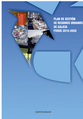
Portada do Plan de Xestión de Residuos Urbanos de Galicia 2010-2020

2020, unha das novidades que presenta o Plan é a incorporación das persoas no modelo de xestión. É dicir, a importancia das accións colectivas como sociedade e das individuais como cidadáns para cumprir cos obxectivos marcados: reducir a produción de refugallos, incrementar a reutilización e a reciclaxe, e minimizar o vertido final.