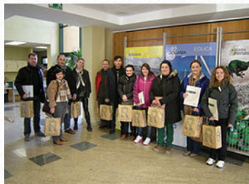
O complexo medioambiental de Cerceda inaugurouse en xaneiro do ano 2000

O interese pola actividade do complexo medioambiental tamén se manifesta no crecente número de consultas á páxina web institucional e no elevado número de seguidores nas redes sociais.