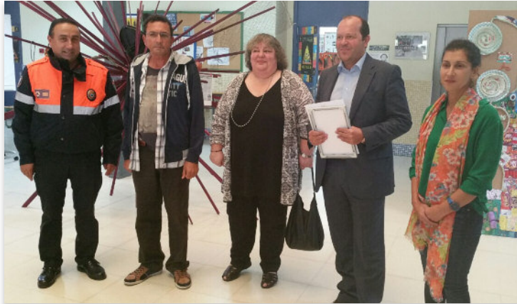
Entrega do primeiro premio ao IES A Cachada de Boiro