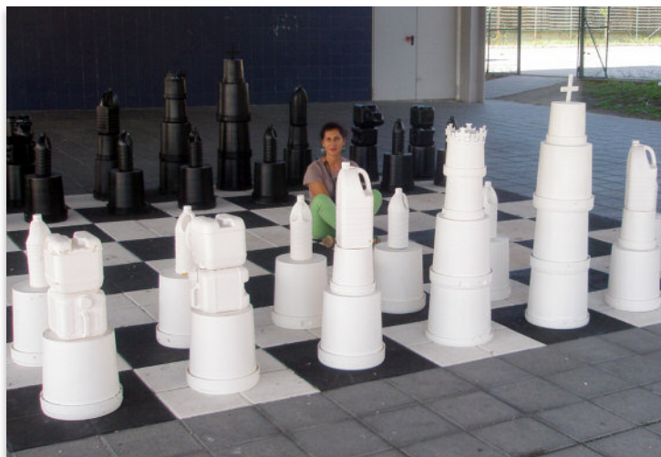
Todos os traballos, incluído este xadrez xigante, foron feitos con material de refugallo

Co espírito dos 3R sempre presente, seguiremos a traballar no aproveitamento de recursos. Continuaremos coa recollida selectiva na illa de reciclaxe e, desde o Departamento de Tecnoloxía, deseñárase e construírase un proxecto de cara ao Nadal que se chamará "O refuxio da fraga". Consistirá en facer estruturas de árbores con material reciclado e coa temática, tan actual, dos refuxiados. Neste proxecto faremos partícipes a varios departamentos do noso centro.