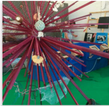
A obra "O Crebourizo" foi doada ao Encontro de Embarcacións Tradicionais de Cabo de Cruz, celebrado en xullo pasado