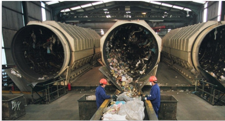
Traballos de tratamento do lixo no complexo de Sogama en Cerceda (A Coruña)

A licitación contempla a construción dunha nova planta para a recuperación dos envases, así como a remodelación da nave actual de reciclaxe, tratamento e elaboración de combustible (PRTE).