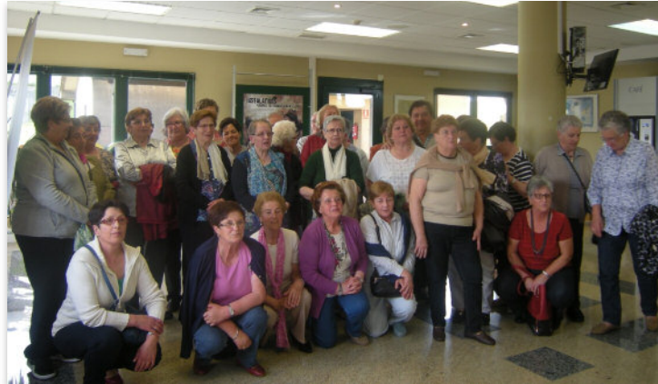
Veciños do municipio de Miño durante a visita ás instalacións de Sogama en Cerceda