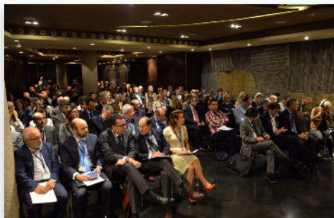
Público durante a xornada inaugural

Por outra, a área máis clásica, que inclúe a prevención na xeración de residuos, na reutilización e na reciclaxe ata os límites do 70 por cento, recuperando a enerxía do resto.