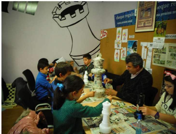
Os alumnos de Xaquedrum fan pezas de xadrez con material reciclado

"A través da colaboración con Sogama, nos colexios xogamos falando tamén da importancia da reciclaxe"