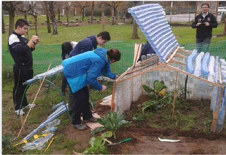
A horta ecolóxica cóidase dúas veces por semana