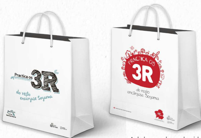
As bolsas son de papel reciclado