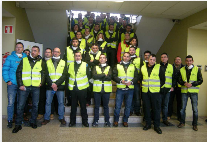
O grupo de policías locais fixo un percorrido polas instalacións de Sogama